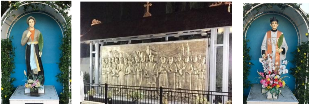
(2 trong số 5 tượng Từ đạo VN)

cũng phải nhớ ơn các vị cha ông từ đạo anh hùng, đổ máu đào gieo mầm cho cái đức tin này trong tâm hồn chúng ta và con cháu. Chính vì thế, bên ngoài đây tôi đặt một số tượng của các ngài, còn bên trong nhà nguyện tôi treo hình ảnh các vị thừa sai đến giảng đạo tại quê hương ta trước đây, cũng như các vị chủ chăn tiên khởi chăm sóc đoàn chiên thuở ban đầu.