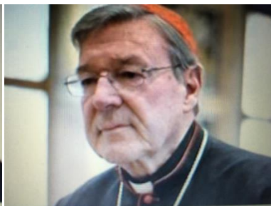
Cardinal George Pell