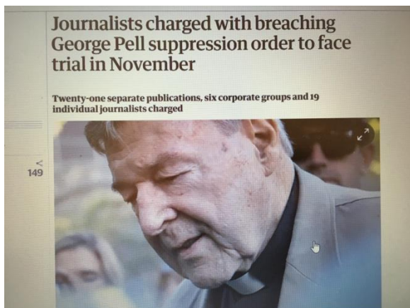
Bài báo trên The Guardian

Bài báo trên tờ The Guardian – 9pm (02/09/2020) của nhà báo Amanda Meade