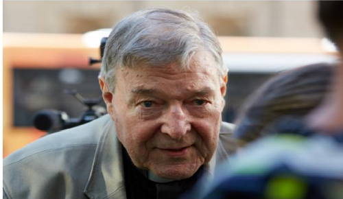
Cardinal George Pell arrives at County Court in Melbourne, Australia, Feb. 27, 2019. Dozens of Australian journalists and publishers are set to face trial in November over coverage of ex-Vatican treasurer George Pell's

Melbourne, Australia / Tue, May 26, 2020 / 04:00 pm