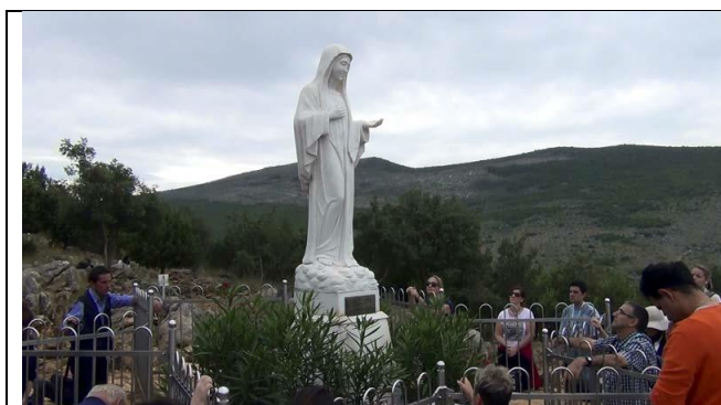
Đức Mẹ trên núi thấp