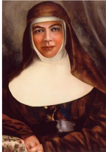
Chân dung Mẹ Mary MacKillop