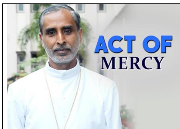
Hành vi hiến thân của Đức cha là một hành vi của Lòng Thương Xót

Sau khi cha Chiramel nhận được tin Đức cha sẵn sàng hiến thân cho một giáo dân Ấn giáo vào năm 2008, cha đã thành lập Hiệp hội hiến thân Ấn Độ, khích lệ việc hiến thân hầu cứu giúp những người đang bị bệnh này.