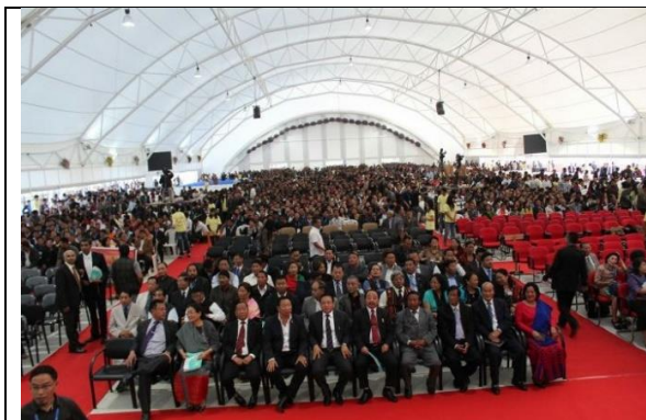
Tín đồ của Giáo phái Báp-tít ở Nagaland trong một đại lễ.

Giáo phái này tuyên bố rằng Chúa đang nói với nhân loại qua bà Yang, người mà "tất cả những giảng dạy của bà được viết thành sách như những mặc khải từ Chúa và được xuất bản, quảng bá qua sách báo, video, phim ảnh nghệ thuật và nhiều hình thức truyền thông khác".