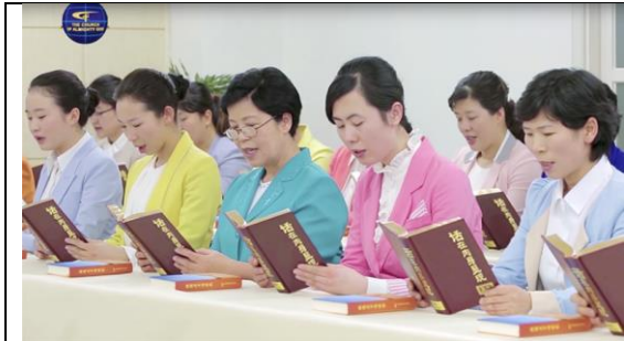
Các thành viên của "Thiên Chúa Cha Toàn Năng", học hỏi Kinh thánh

Vị mục sư cho biết những người trẻ ở Naga "dễ bị cuốn hút bởi những chiến dịch khôn ranh như vậy. Một số là tín đồ theo đạo vì họ được sinh ra trong các gia đình có đạo. Họ hầu như không biết về giá trị, nội dung chân lý và giáo lý thực sự của tôn giáo".