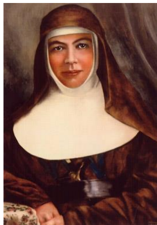
Chân dung Mẹ Mary MacKillop